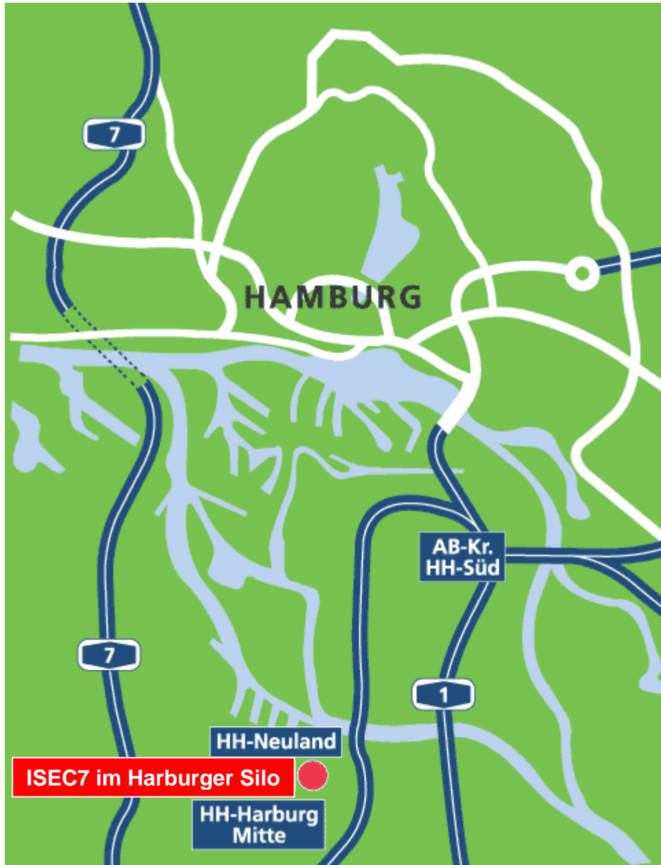
Lage ISEC7 - Hamburg

ISEC7 GmbH Sitz: Hamburg Schellerdamm 16 D-21079 Hamburg Tel.: 040 – 32 50 76 0 Fax: 040 – 32 50 76 28